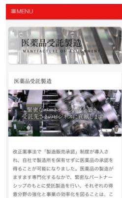
【スマートフォン対応】