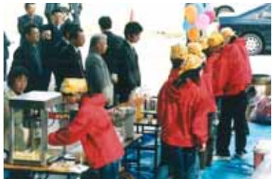
= 懇親会場(飲食コーナー) =