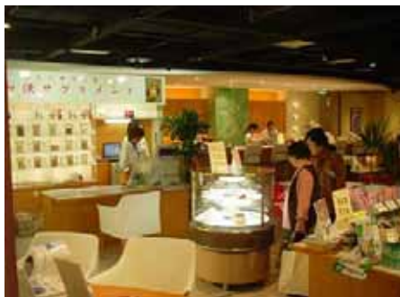
= 健康食品等の物販コーナー =