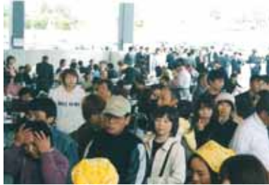
= 懇親会場(飲食コーナー) =

液剤2億本の生産体制を確立するためのドリンク専用工場が完成し、その竣工式を10月26日におこないました。竣工式当日は、関係者だけでなく地域住民の皆様にも工場の見学会や懇親会に多数ご参加頂き、成功裡に終了する事ができました。(ご参加者数:約800名余)