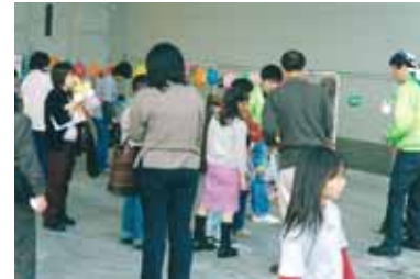
= 懇親会場(遊楽コーナー) =