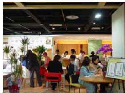
= 飲食提供コーナー =