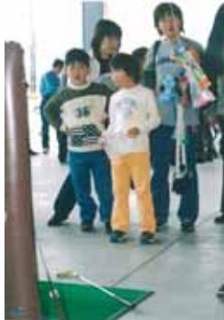
= 懇親会場(遊楽コーナー) =