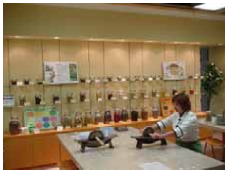
= ハーブ体験コーナー =

配置販売業における新しいビジネスモデルを構築するための一環として、広貴堂メディフーズ(広貴堂の子会社)を設立し、和漢の素材を使ったサプリメントや食による生活習慣病予防のコンセプトをベースに、消費者に満足していただけるビジネスモデルを構築していくためのアンテナ・ショップとして、富山駅前CIC店5階に「癒楽甘・春々堂」を11月30日にオープンさせました。