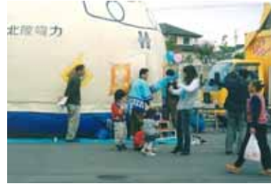
= 懇親会場(体感コーナー) =